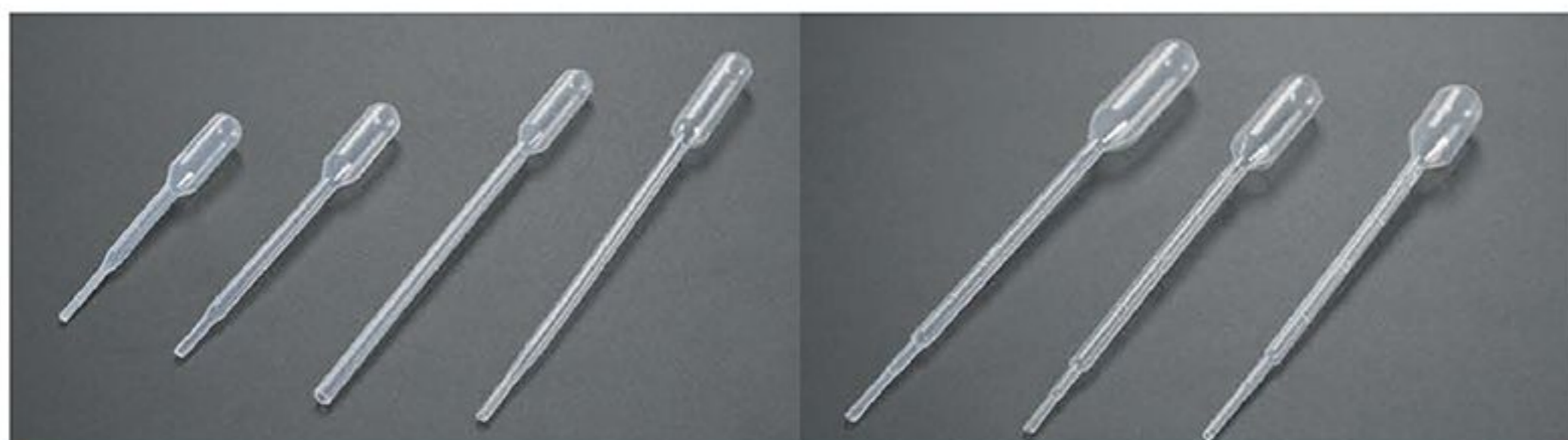
LA07001 LA07002 LA07003 LA07004