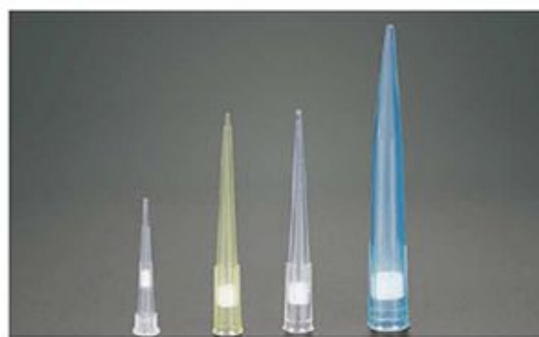
LA08014 LA08015 LA08016