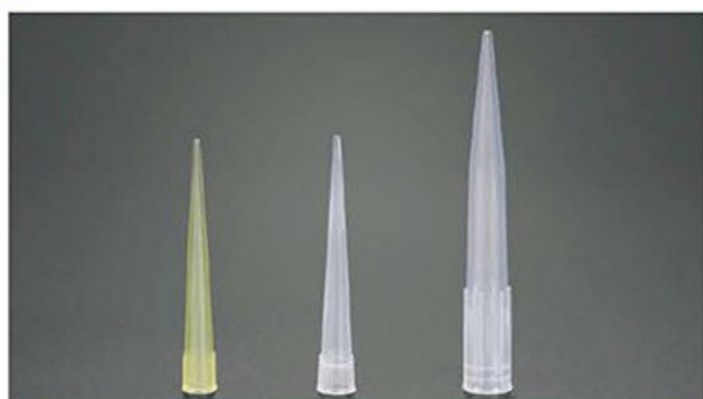
LA08001 LA08002 LA08003