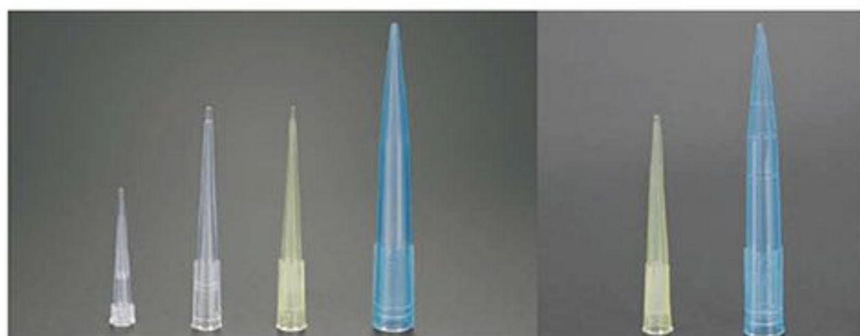
LA08008 LA08009 LA08010 LA08011 LA08012 LA08013