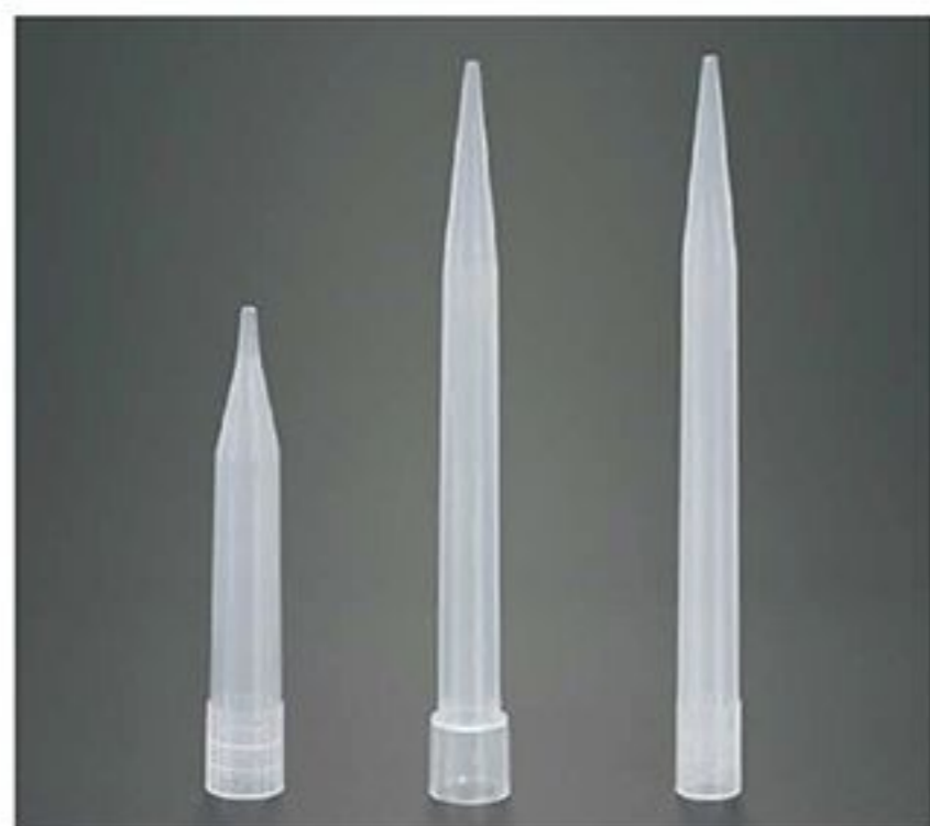
LA08017 LA08018 LA08019