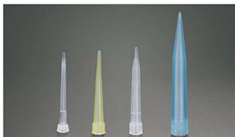
LA08004 LA08005 LA08006 LA08007